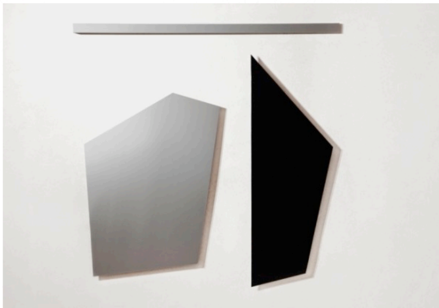
Magnoni, Immagine Spazio 1, 2013

Nel cuore degli anni '60 Magnoni esplora la geometria e la costruttività essenziali non come conseguenze della minimalizzazione concettuale, ma come strumento ideale di qualificazione del luogo.