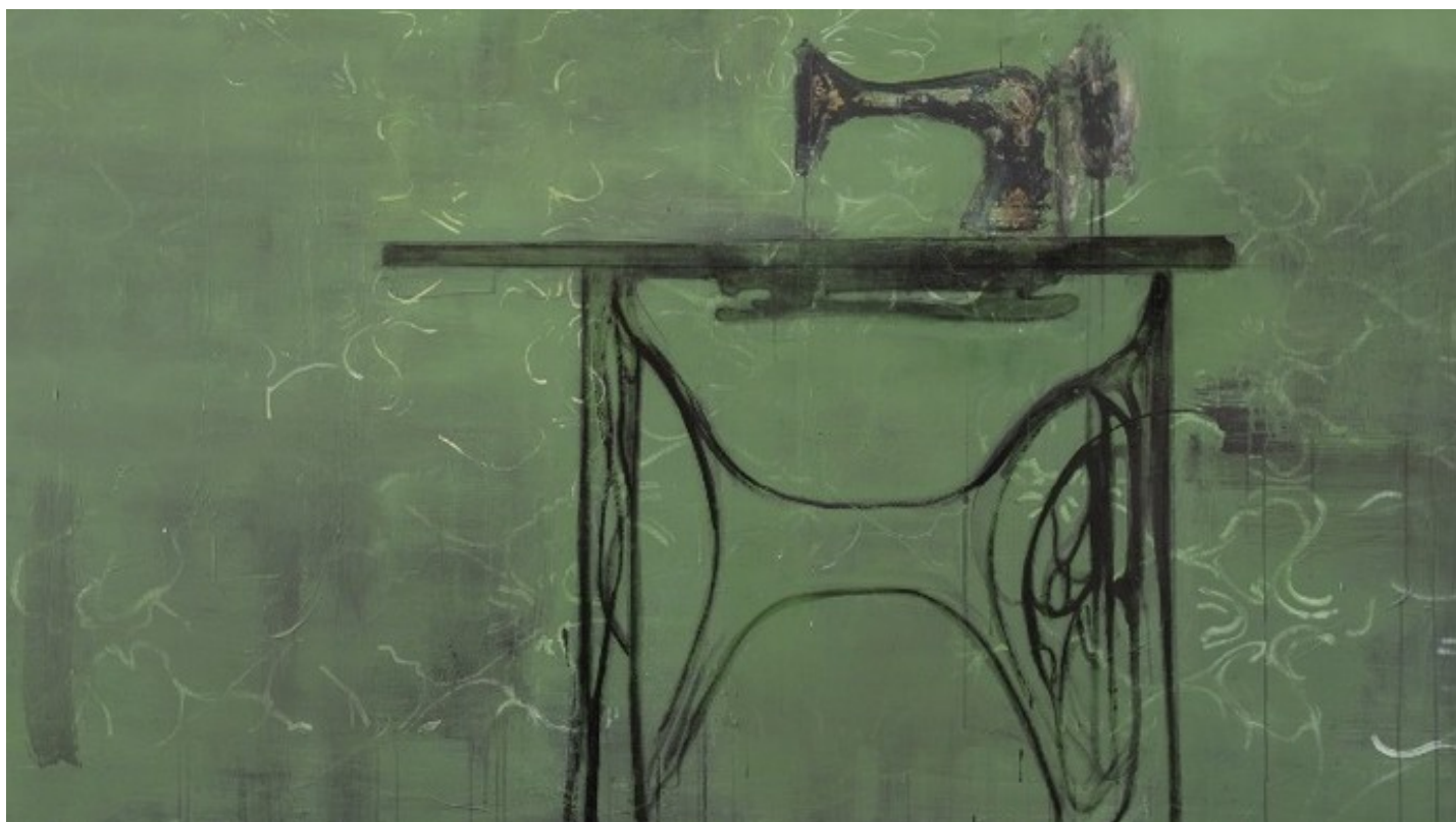
La Distanza Delle Regioni.