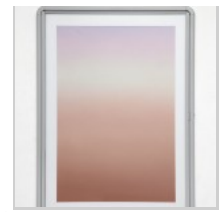
( http://insideart.eu/wp-content/uploads/2015/09/Delimited-beam-1-2015-olio-polvere-di-pietra-calcareo-polvere-di-grafite-su-lino-teca-in-alluminio-vetro-100x75-cm.jpg )