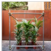
( http://insideart.eu/wp-content/uploads/2015/09/Grove-in-Scaffolding-2015-ferro-piante-180x180x180-cm.jpg )