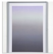
( http://insideart.eu/wp-content/uploads/2015/09/Delimited-beam-3-2015-olio-polvere-di-pietra-calcareo-polvere-di-grafite-su-lino-teca-in-alluminio-vetro-100x73-cm.jpg )