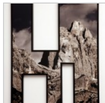
( http://insideart.eu/wp-content/uploads/2015/09/Wall-in-2-2015-stampa-ai-pigmenti-naturali-plexiglass-taglio-a-laser-110x95-cm.jpg )