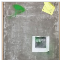
( http://insideart.eu/wp-content/uploads/2015/09/Wall-in-3-2015-cemento-resina-calcestruzzo-acrilico-e-carta-su-tavola-94x74-cm.jpg )