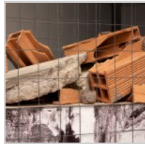
( http://insideart.eu/wp-content/uploads/2015/09/Be-Top-Be-Down-particolare.jpg )

Martina Adami ( http://insideart.eu/author/martina-adami/ )