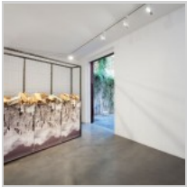
( http://insideart.eu/wp-content/uploads/2015/09/Top-Be-Down-2015-forati-cemento-ferro-legno-stampa-uv-200x230x40-cm.jpg )